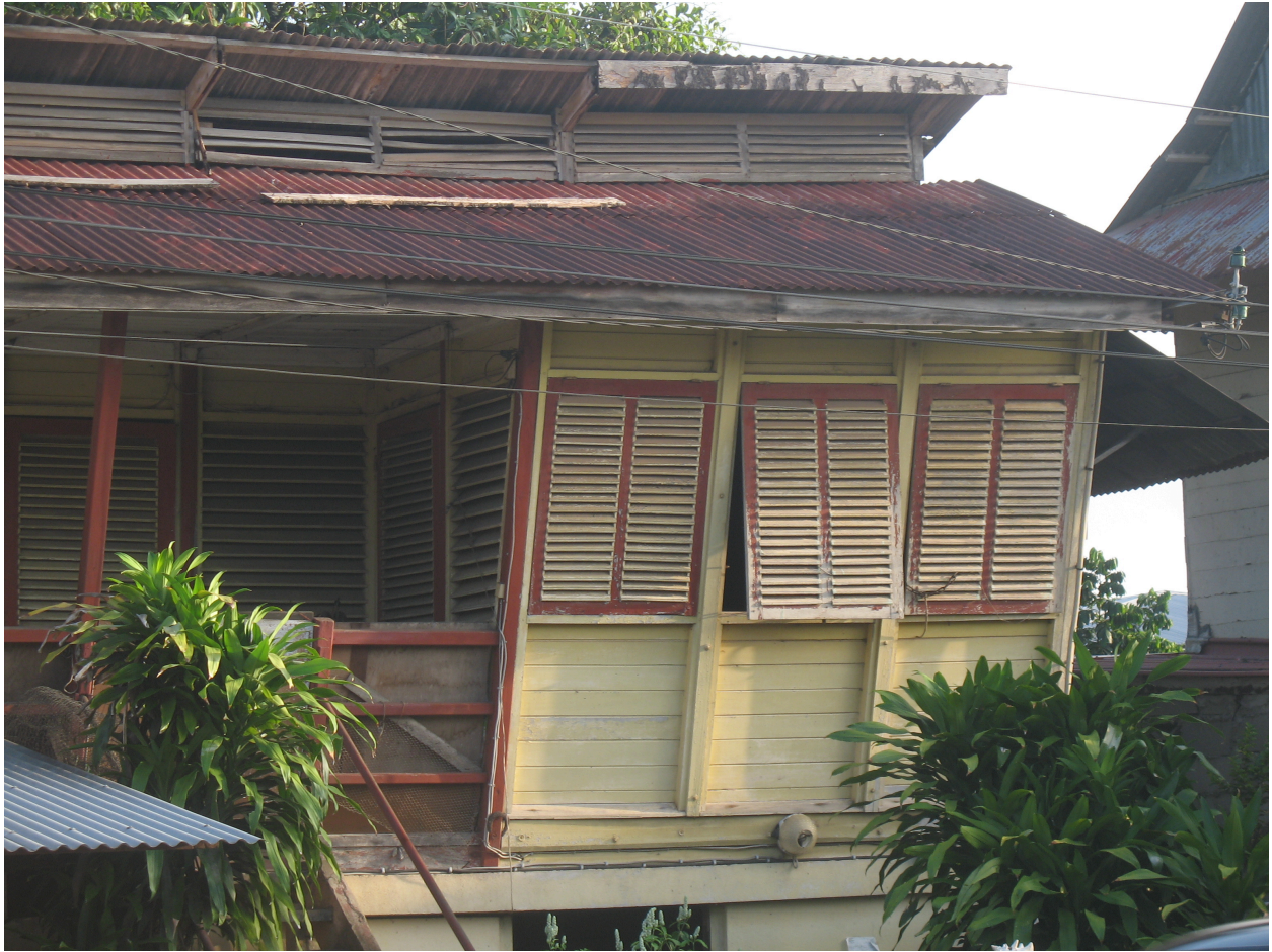
Détail de l'étage à l'est. Etat avant restauration