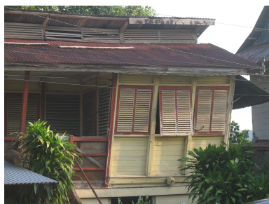
Détail de l'étage à l'est. Etat avant restauration IVR03_202697300038NUCA