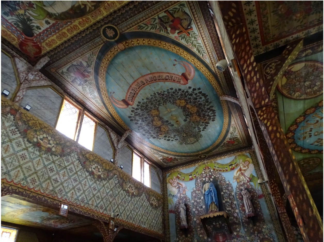
Vue du choeur depuis le bas-côté est