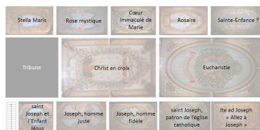
Iconographie des décors peints du plafond IVR03_202697300015NUCA