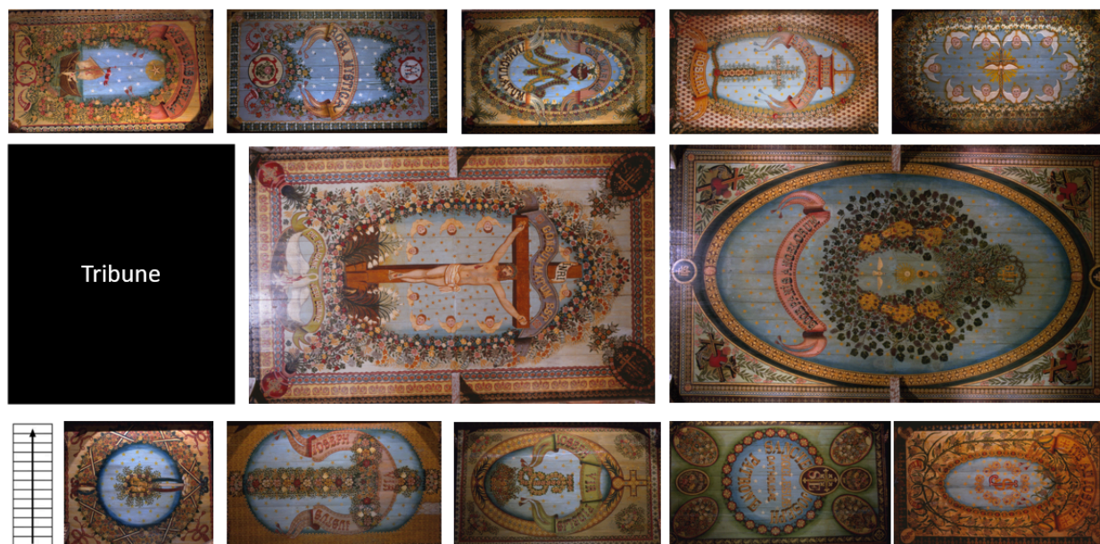
Disposition des différents éléments du décor dans le plafond