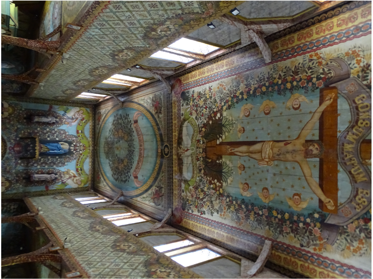
Vue de la nef depuis le narthex