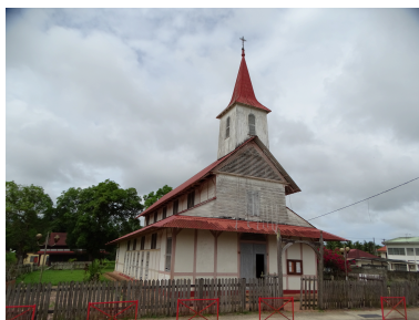
Vue générale IVR03_202697300003NUCA