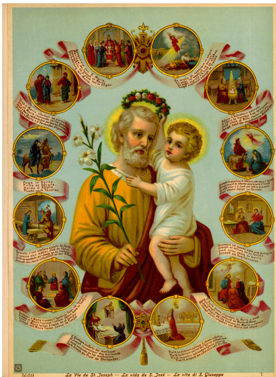
Sérigraphie courante de saint Joseph et l'Enfant marouflée par Huguet dans le bas-côté est.

IVR03_202697300011NUCA