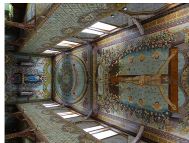
Vue de la nef depuis le narthex IVR03_202697300005NUCA