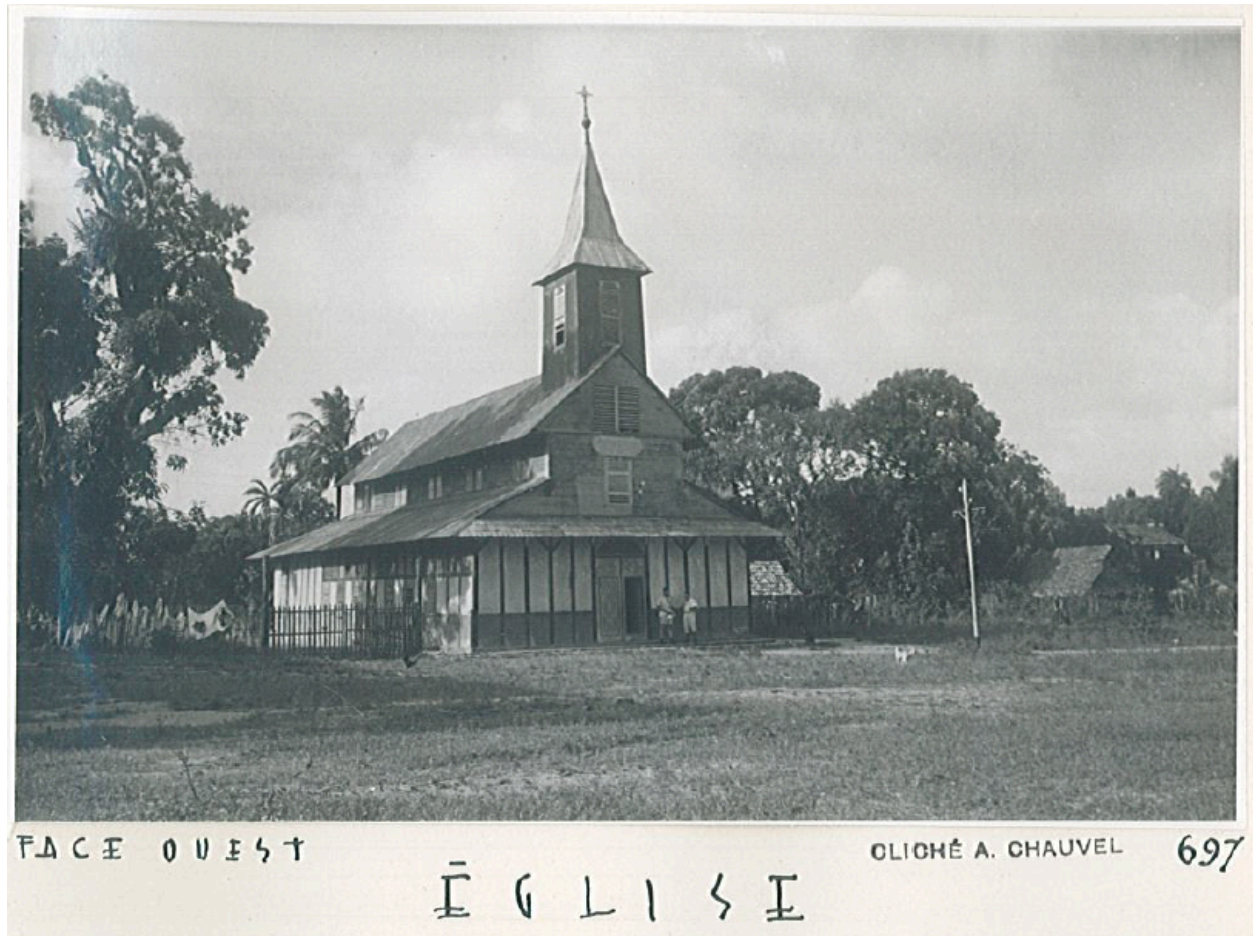
Photographie issue du rapport de la mission Chauvel aux Antilles et Guyane, Ministère de l'Éducation Nationale, Inspection des Monuments Historiques. 1950