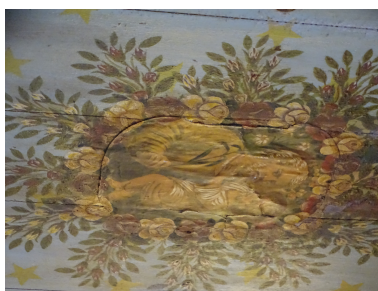
Décor dédié à saint Joseph dans le bas-côté est: détail de la sérigraphie marouflée IVR03_202697300008NUCA