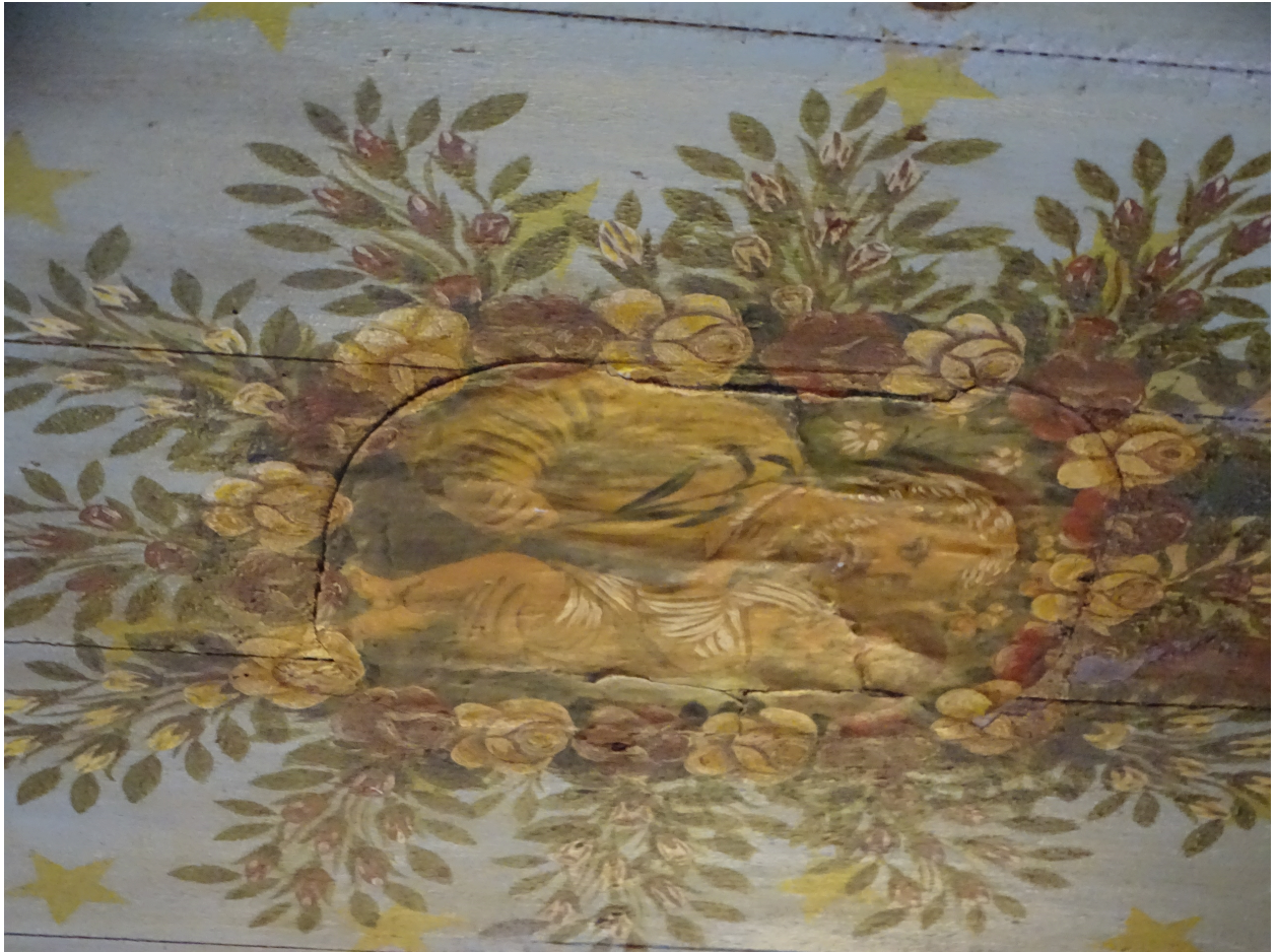
Décor dédié à saint Joseph dans le bas-côté est: détail de la sérigraphie marouflée