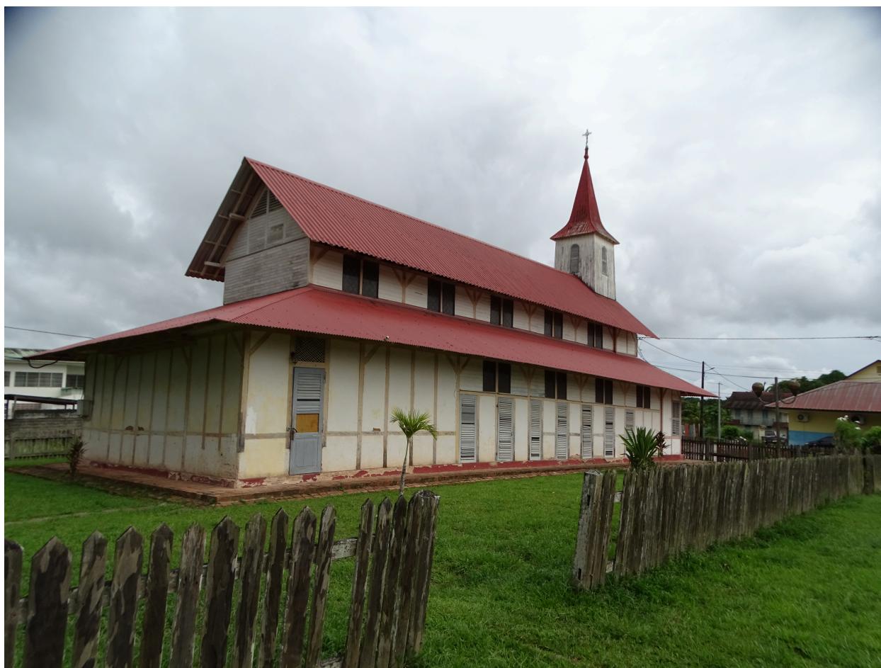
Chevet depuis le sud