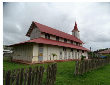
Chevet depuis le sud IVR03_202697300004NUCA