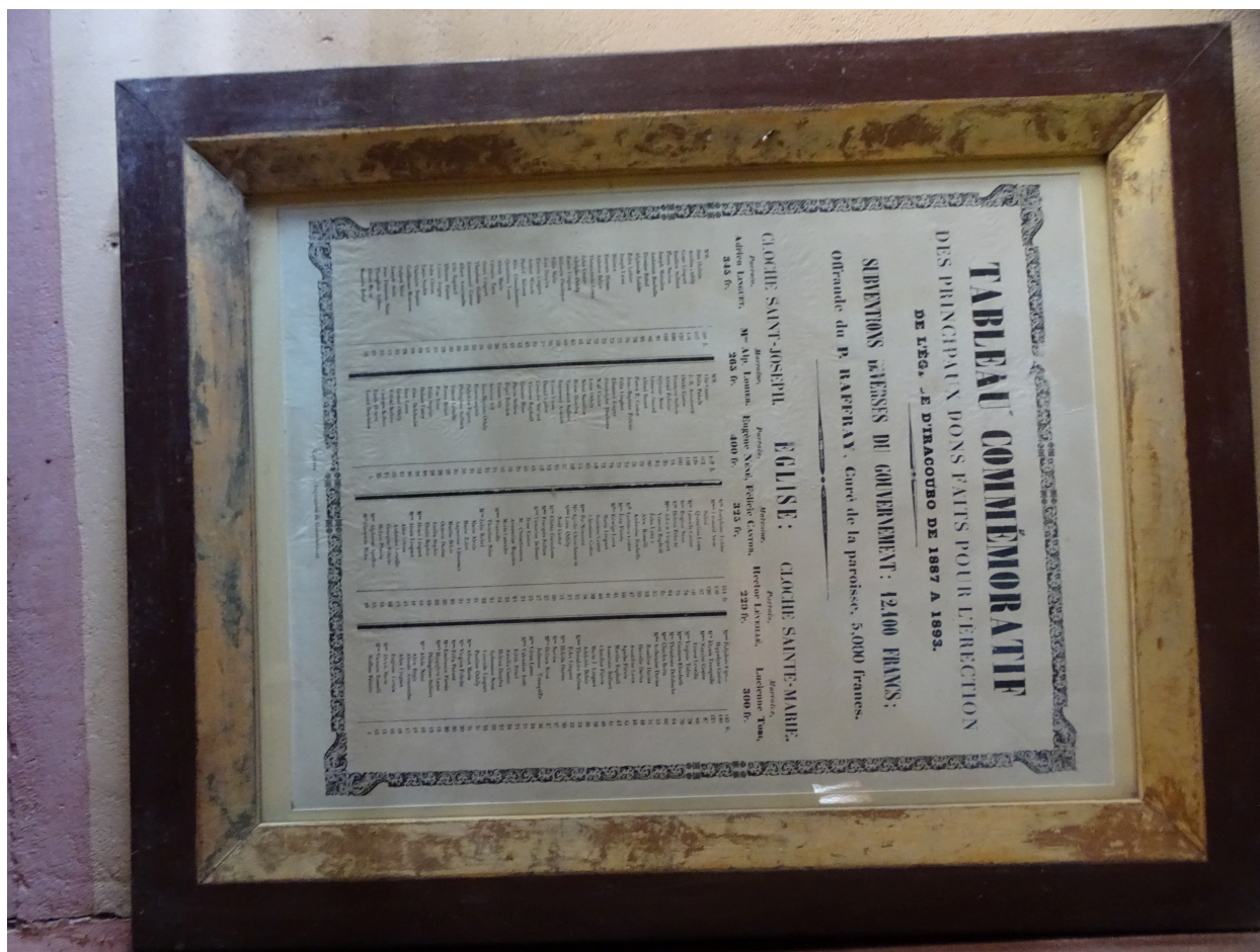
Détail du tableau commémoratif avec les contributions des habitants

IVR03_202697300007NUCA Auteur de l'illustration : Lionel Besnard Date de prise de vue : 2026 Collectivité Territoriale de Guyane reproduction soumise à autorisation du titulaire des droits d'exploitation