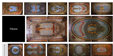
Disposition des différents éléments du décor dans le plafond