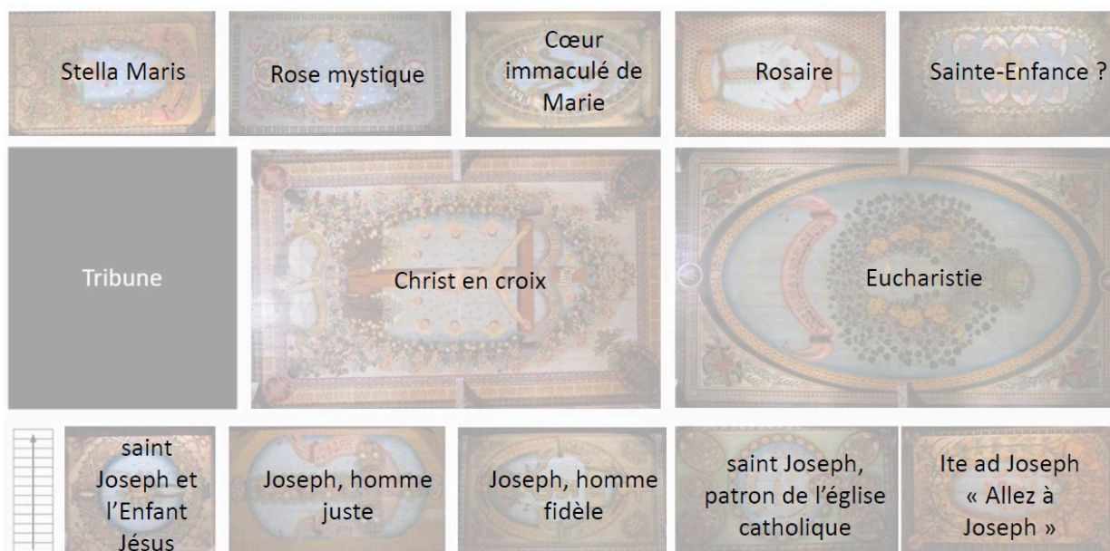
Iconographie des décors peints du plafond