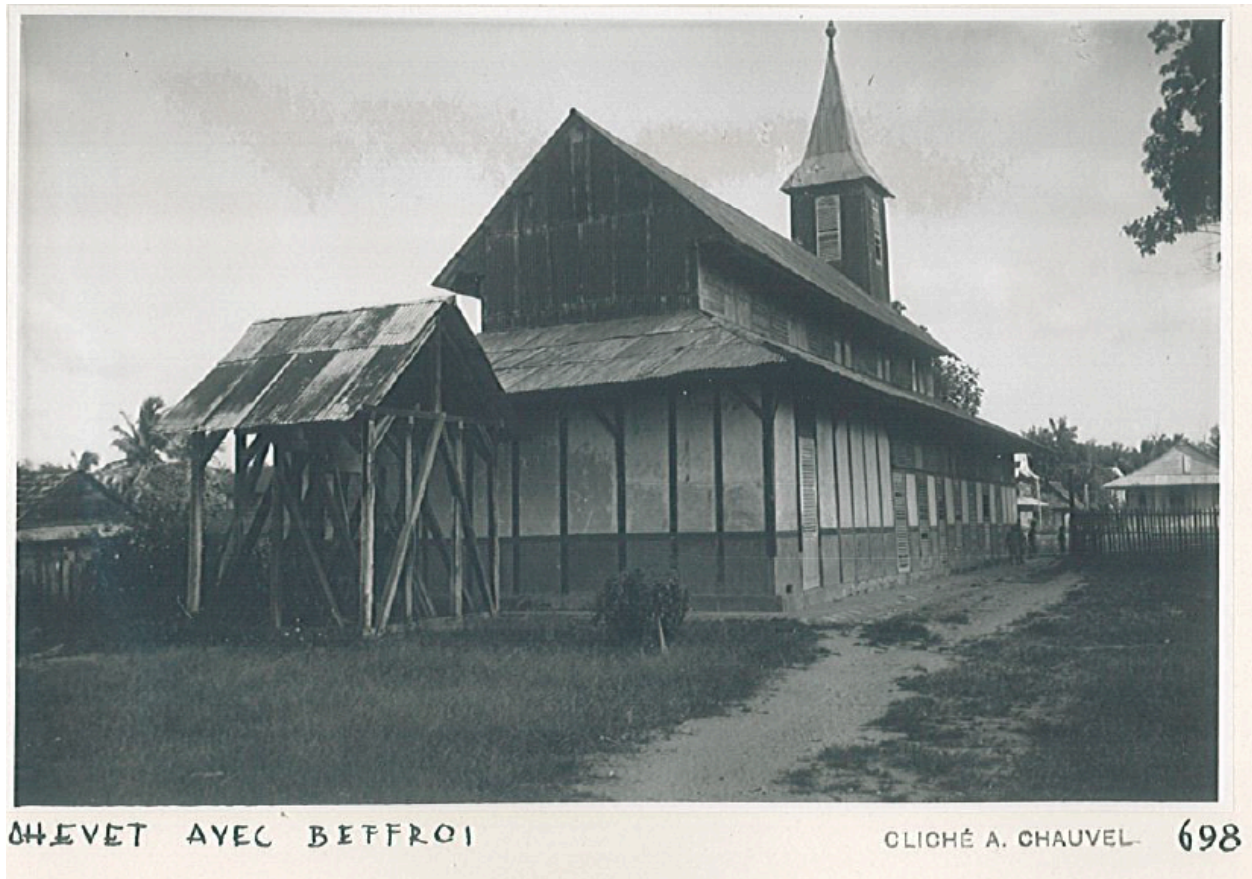
CHÉVET AVEC BEFFROI