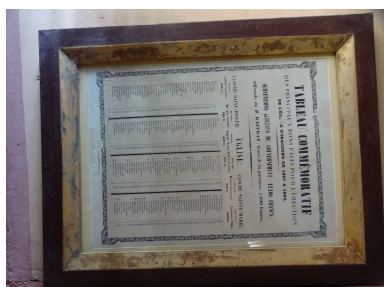
Détail du tableau commémoratif avec les contributions des habitants