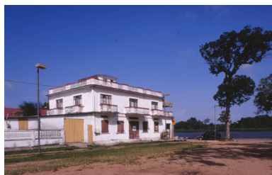
Vue depuis la place Yves Patient en 1995