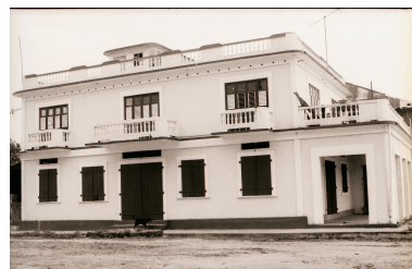
Vue générale de la façade sud sur la place Yves Patient