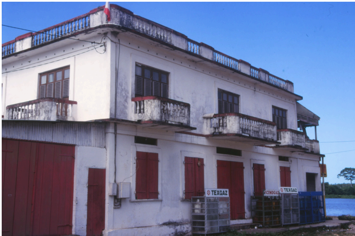
Façade sud en 1998 depuis la place Yves Patient