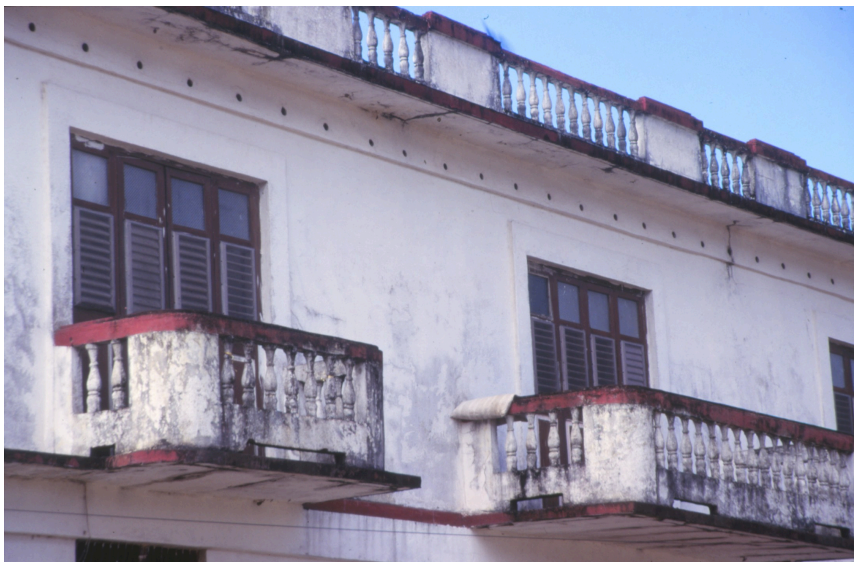
Détail des balcons et des garde-corps en ciment moulé