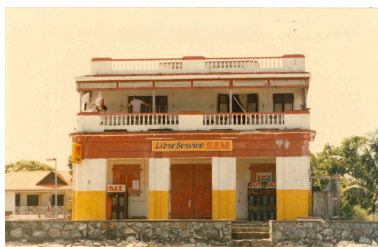
Vue de détail du commerce et de la terrasse à l'est depuis le quai du fleuve en 1997 IVR03_199797300771ZA