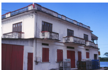
Façade sud en 1998 depuis la place Yves Patient