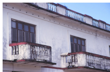
Détail des balcons et des garde-corps en ciment moulé IVR03_199897300182ZA