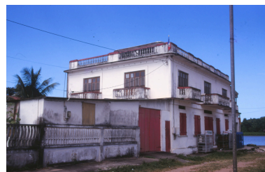
Vue générale depuis la place Yves Patient en 1998