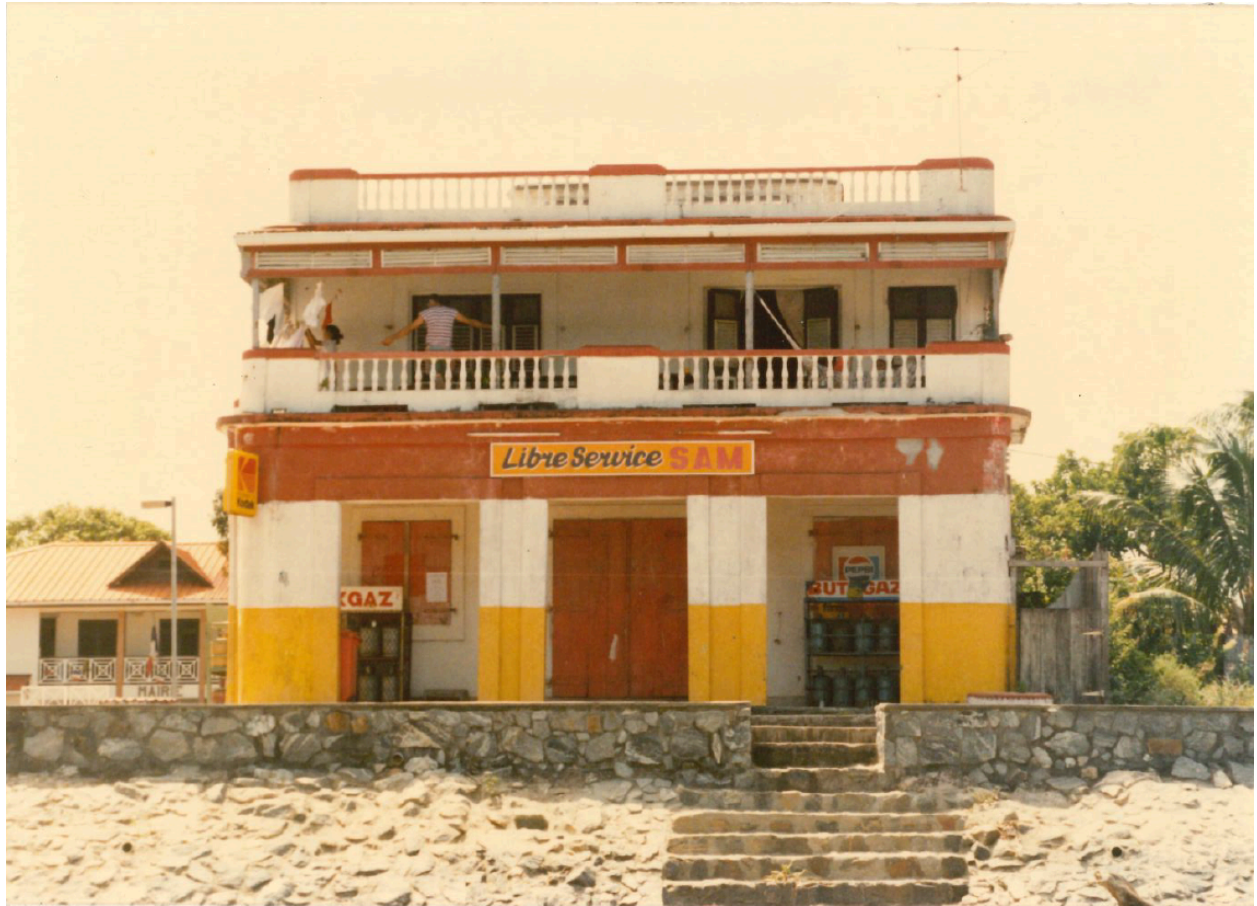
Vue de détail du commerce et de la terrasse à l'est depuis le quai du fleuve en 1997