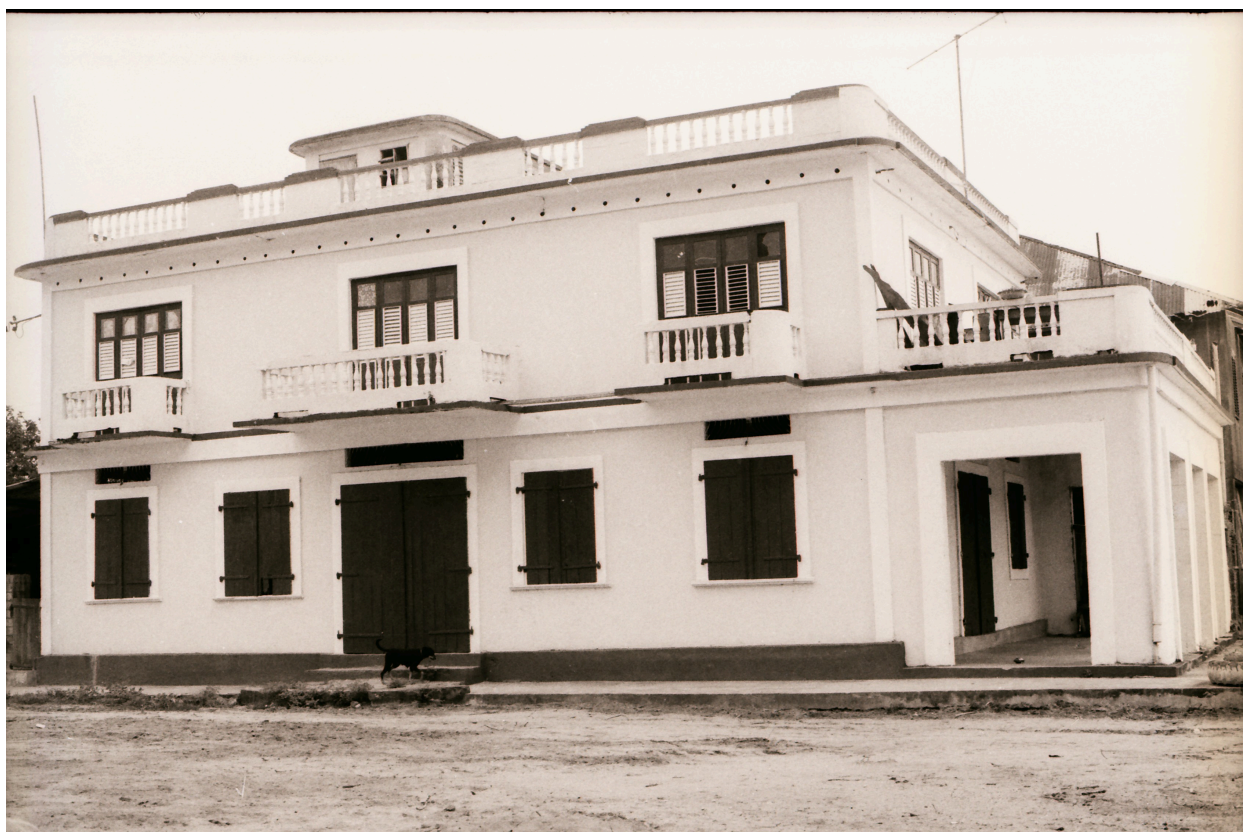
Vue générale de la façade sud sur la place Yves Patient