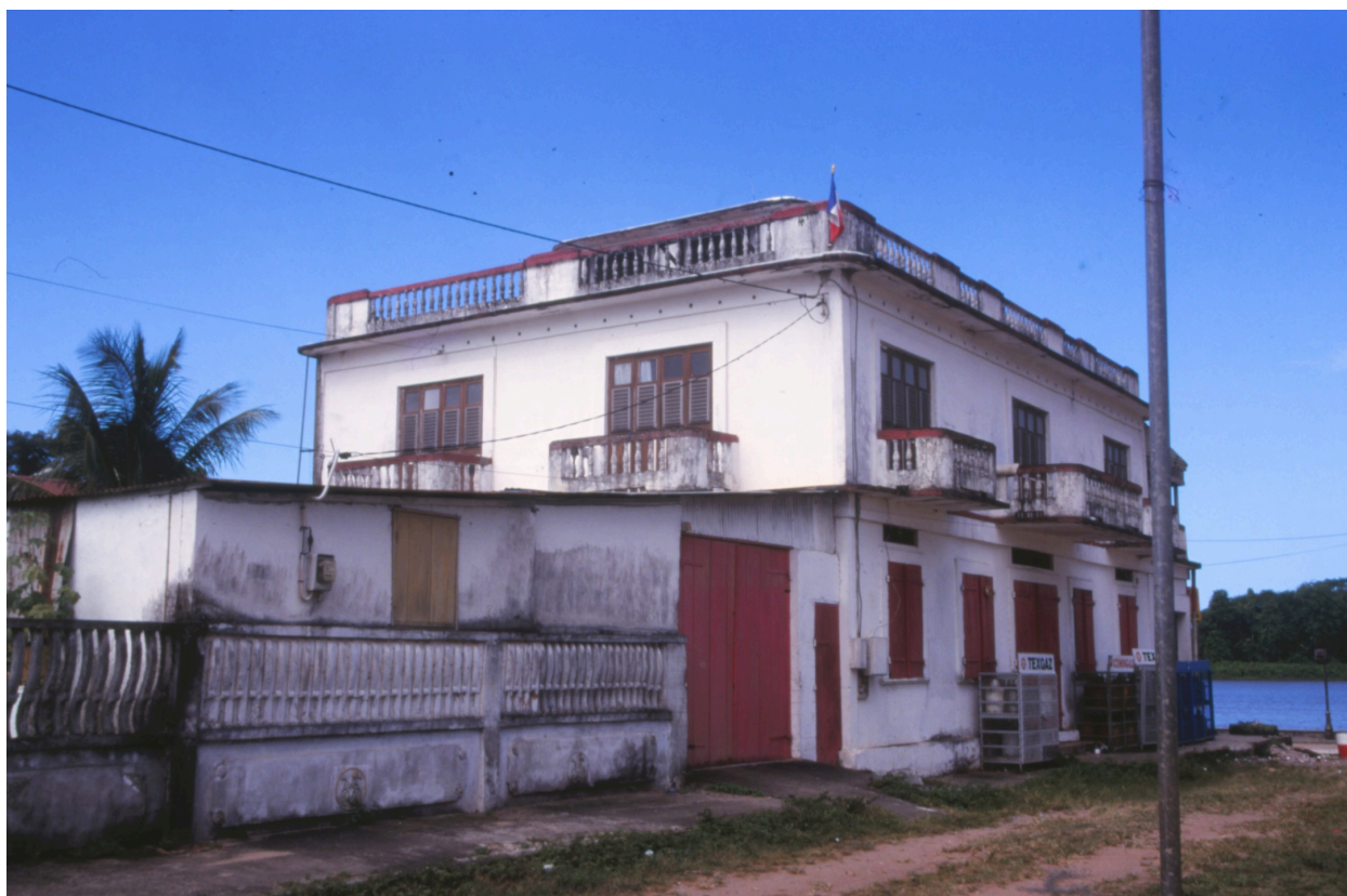
Vue générale depuis la place Yves Patient en 1998