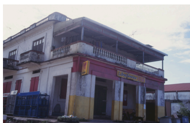
Vue du commerce et de la terrasse depuis le quai en 1998 IVR03_199897300180ZA