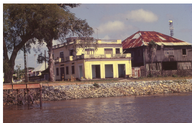
La maison depuis le fleuve Mana, vers 1980 IVR03_202097302093ZA