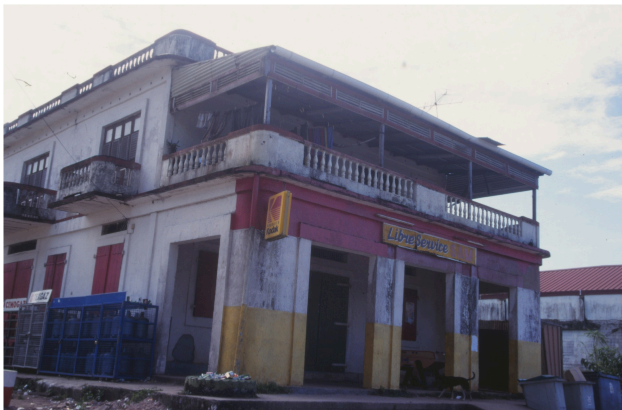
Vue du commerce et de la terrasse depuis le quai en 1998