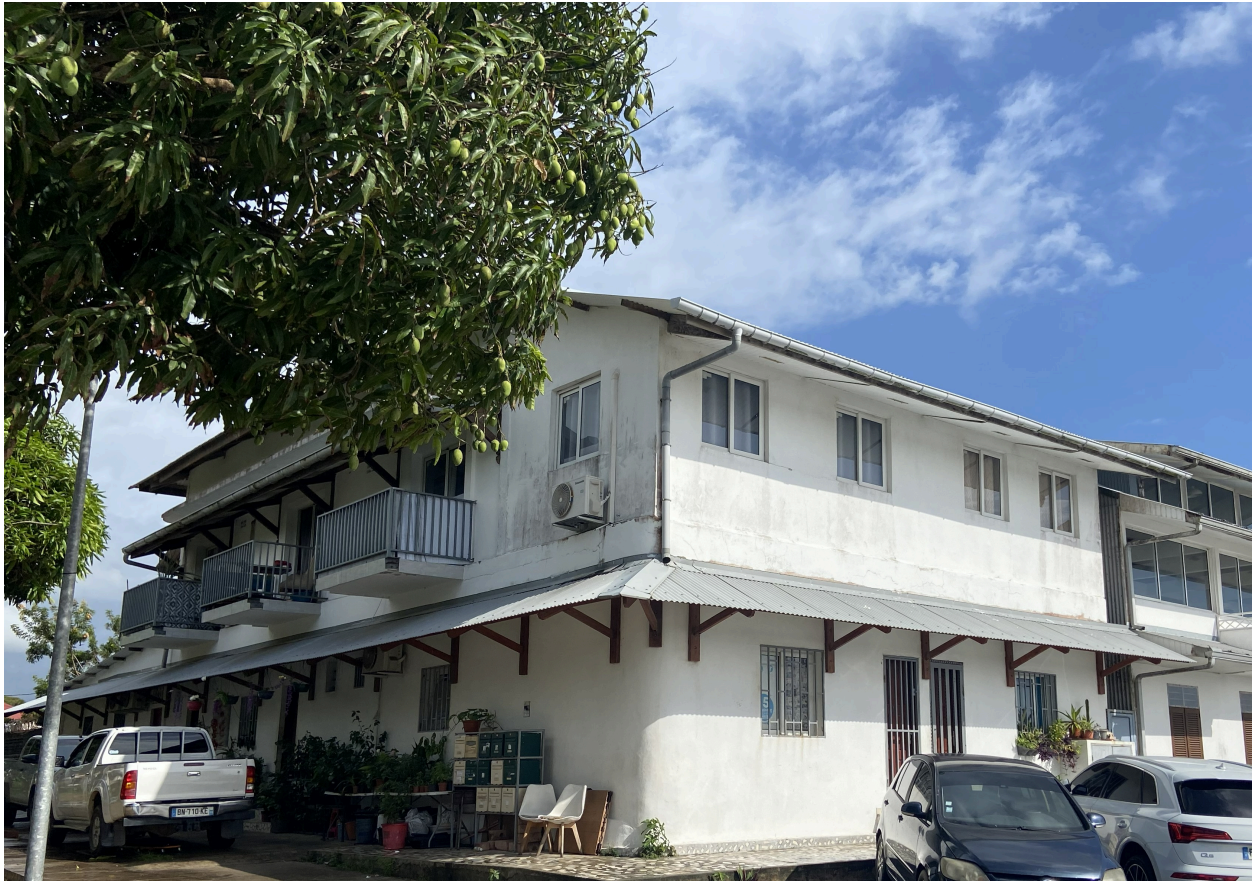
La maison en 2026 depuis le quai

IVR03_202697300040NUCA Auteur de l'illustration : Lionel Besnard Date de prise de vue : 2026 Collectivité Territoriale de Guyane reproduction soumise à autorisation du titulaire des droits d'exploitation