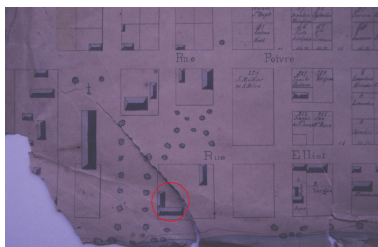
En rouge, l'emplacement de la maison sur le "plan figuratif du bourg de Mana" en 1875 IVR03_199497300495ZAB