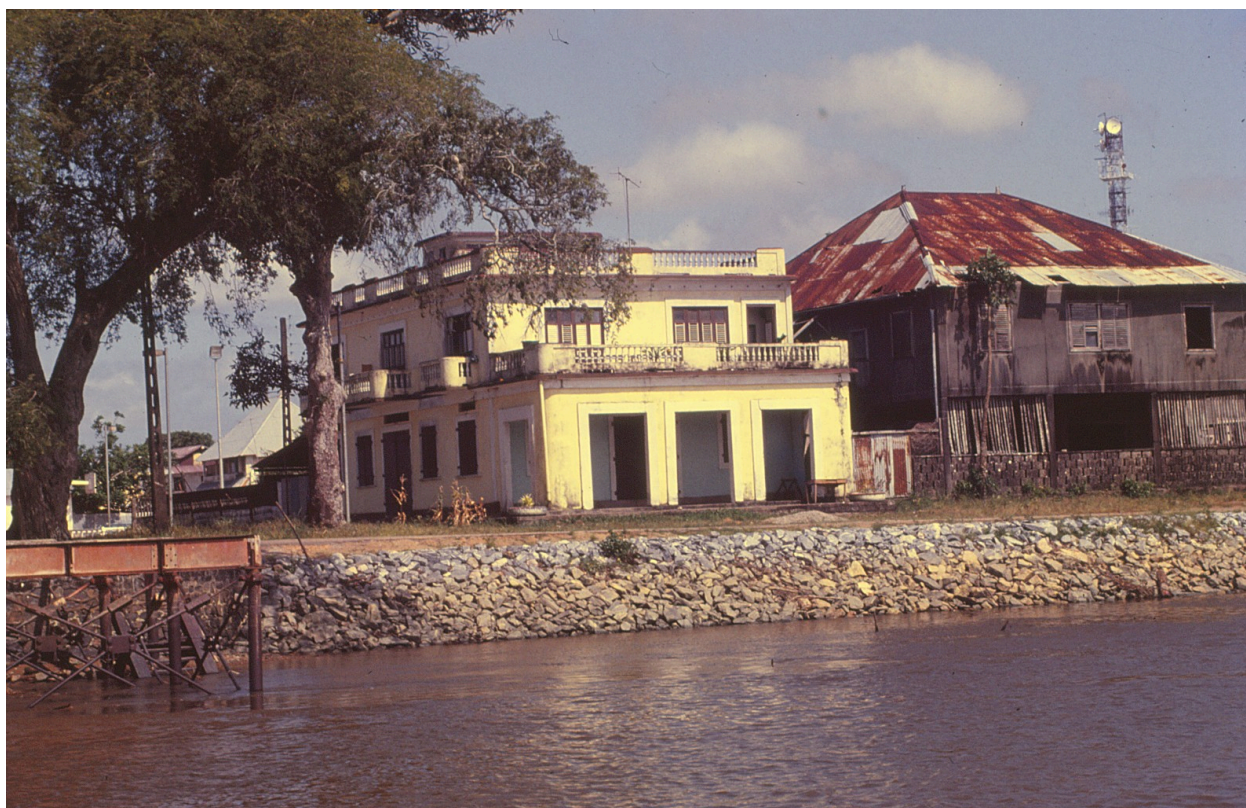
La maison depuis le fleuve Mana, vers 1980