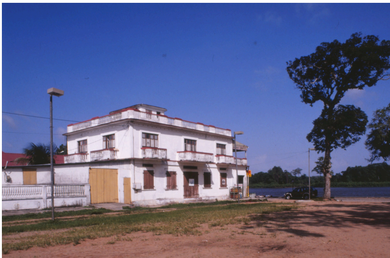
Vue depuis la place Yves Patient en 1995